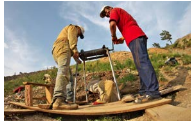
Kleinschürfer*innen bauen Gold in der Bonuur Mine in der Mongolei nachhaltig ab, d.h. hier zumindest ohne den Einsatz von Quecksilber.